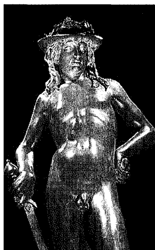
In mostra Il David di Donatello